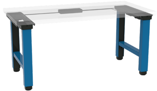
move X2 Pro Ampliado con un embellecedor de patas con travesaño y diferentes colores para elegir libremente