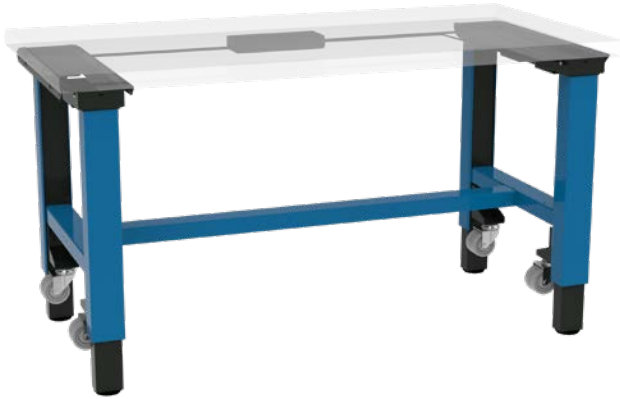
move X2 Móvil Modelo móvil con juego de ruedas y travesaño