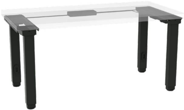
move X2 Basic Modelo básico con dos patas (4 columnas de elevación)